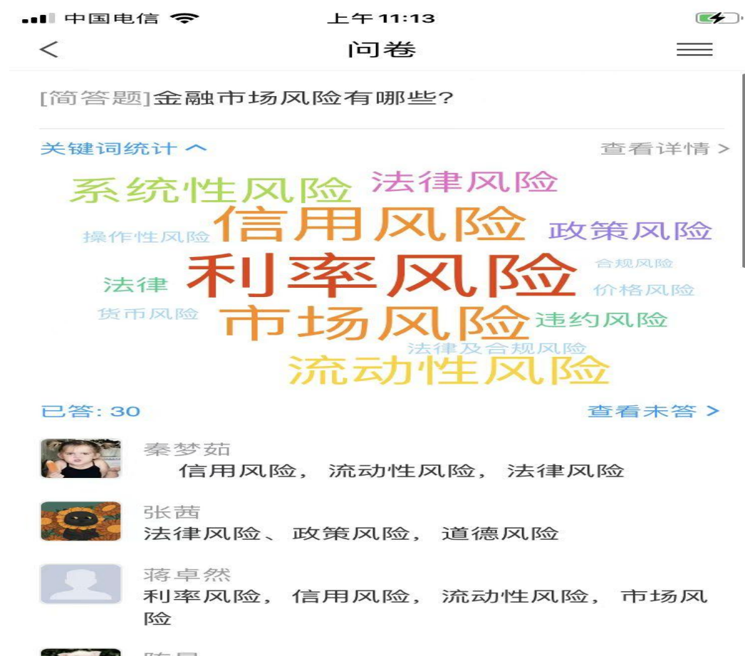
图 4: 问卷调查结果