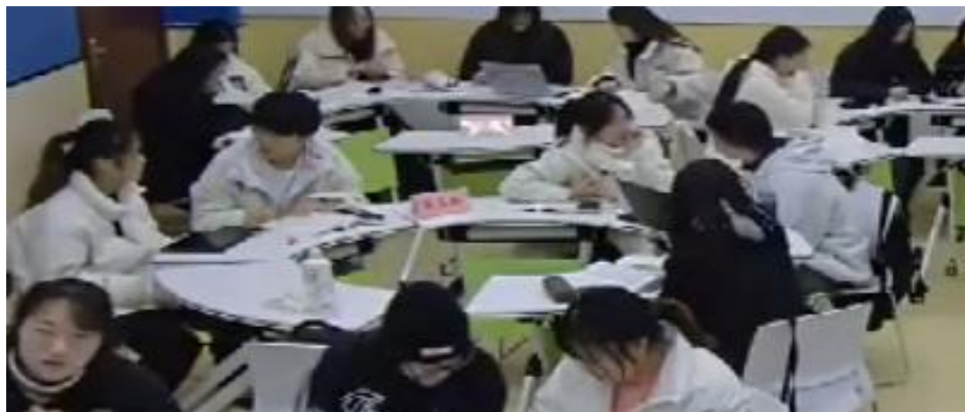
图 5: 分组讨论场景1