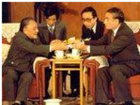
图 7: 邓小平赠送菲尔霖股票